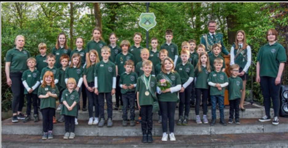
Die Jüngsten der Schützengilde Herzebrock versammelten sich zum Gruppenfoto.