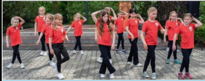
Die Tanzgruppe »die Tanzmäuse« des HSV