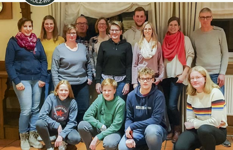
Vorstand, Neuaufnahmen und Geehrten des Spielmannszug Clarholz-Heerde