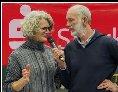
Bundestrainerin Brigitte Kurschilgen im Gespräch mit Hochsprungmeeting-Moderator Achim Milde