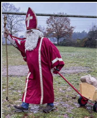
Der Nikolaus war am 6. Dezember unterwegs in der Gemeinde

Unsere Fotografen der Markt & Gemeinde und andere waren kürzlich unterwegs und trafen lauter nette Leute aus der Gegend.