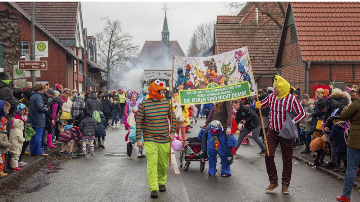
Mitte Februar lockt der alljährliche Karnevalsumzug wieder zahlreiche Schaulustige nach Möhler.

Ab 14 Uhr nehmen die Wagen und Fußgruppen an der Menninghausener Straße Aufstellung und etwa ab 14:30 Uhr setzt sich der Zug mit seinen Narren in Bewegung entlang der Kapellenstraße durch die Ortschaft. Die Möhleraner und die Gruppen aus der Umgebung haben in den Wochen zuvor alles getan ihren Umzug vorzubereiten. Sie wollen dem Publikum aus der Region eine Menge farbenfrohe Ideen und vielleicht auch einige kritische Anmerkungen präsentieren und zahlreiche Gäste sind wieder der schönste Lohn für die Mühen der Wagenbauer und der zahlreichen fantasievoll kostümierten Fußgruppen.