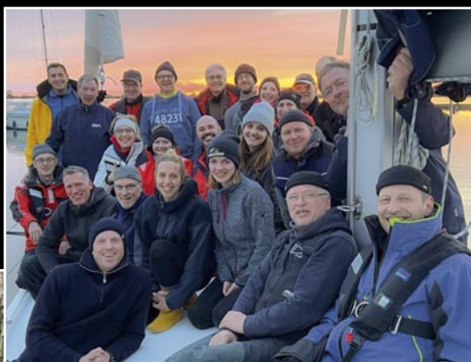
Die neuen Skipperinnen und Skipper des WWV mit ihren Ausbildern im Hafen von Lelystad