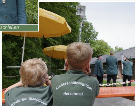
Auch die Kleinsten verfolgen gespannt den Wettkampf um die Königswürde