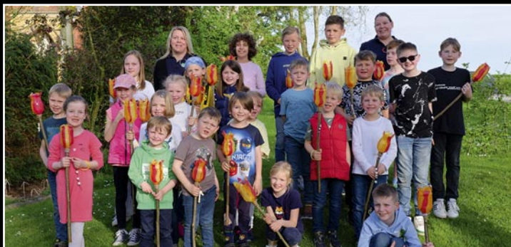
Diese Kindergruppe waren mit ihren farbenfroh gebastelten Flammen beim Umzug im Zuge des Feuerwehrfestes dabei