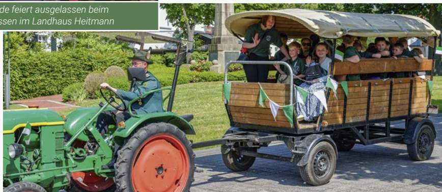
Die Kinderschützen genießen den Umzug in der Kinderkutsche