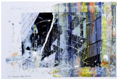
links: Karl-Heinz Reichhardt: OUT OF BLUE, 2022 (Pur Epoxi-Lack, 61 x 48 x 40 cm) rechts: Karl-Heinz Lux: Axel Springer Haus, 2022 (Acryl, Blei- und Farbstift, Fotografie auf Karton, 27 x 18 cm)