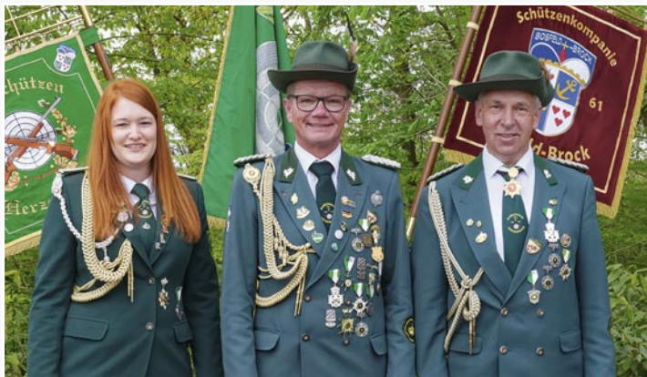
Die Vorsitzenden der Schützengilde präsentieren sich beim Anschießen