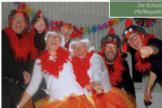
Schützengilde feiert bunt verkleidet Karneval im Schützenheim