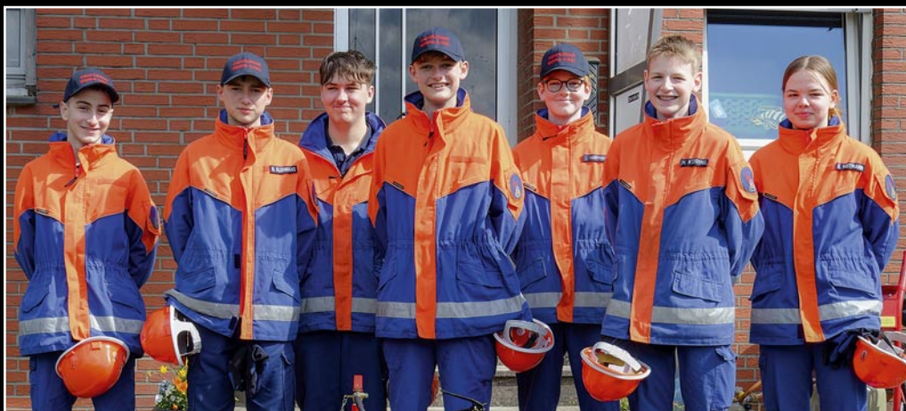
Auf der Möhler Ludgeruskirmes gab es bei der Jugendfeuerwehr Herzebrock-Carholz die Möglichkeit, mit Feuerlöschern zu üben