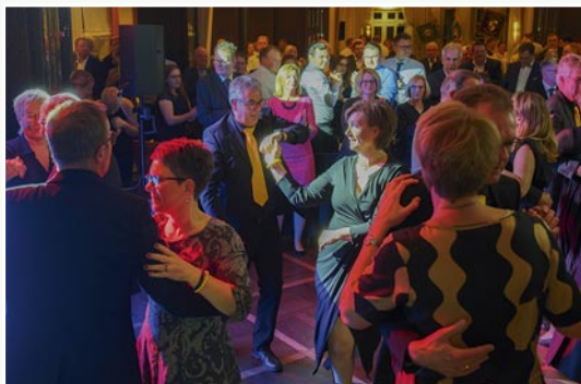
Die Schützengilde feiert ausgelassen beim Pfefferpotthastessen im Landhaus Heitmann