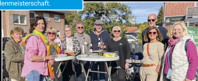
So sah es am Erntedanksonntag vor vielen Häusern an den Straßen aus: Familie und Freunde trafen sich, um sich den Umzug gemeinsam anzusehen und um einfach zu feiern.