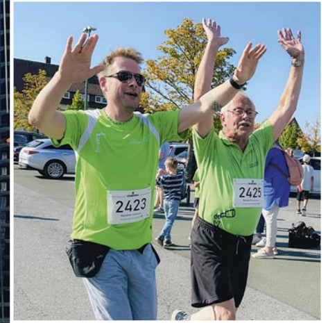
Bei bestem Wetter gingen in diesem Jahr rund 400 Sportler und Sportlerinnen beim Paul-Craemer-Lauf an den Start.