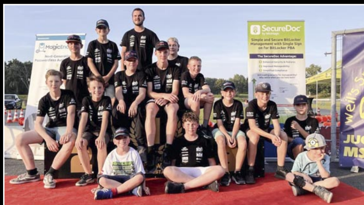
Die Kartslalom-Jugendgruppe des MSC Harsewinkel freut sich über den ersten Platz bei der Westfalenmeisterschaft.