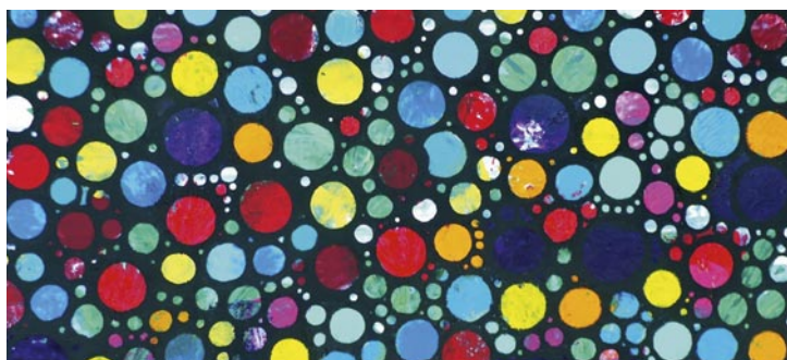
Werner Starke Werk »Mosaik« (Ausschnitt, 2022, Acryl auf Vliestapete) ist u. a. Teil der neuen Ausstellung im Haus Samson.