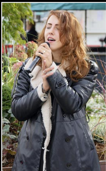
Sängerin Madlen Paulik beim Trödelmarkt.

Unsere Fotografen der Markt & Gemeinde und andere waren kürzlich unterwegs und trafen lauter nette Leute aus der Gegend.