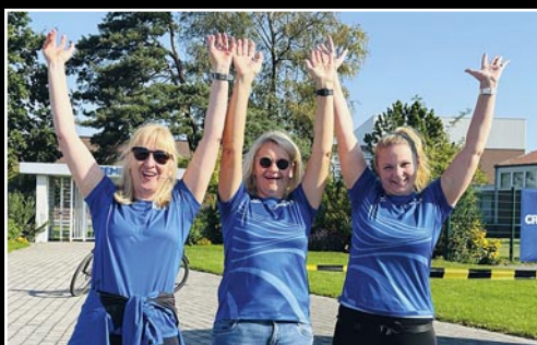
Gute Laune beim Paul-Craemer-Lauf.