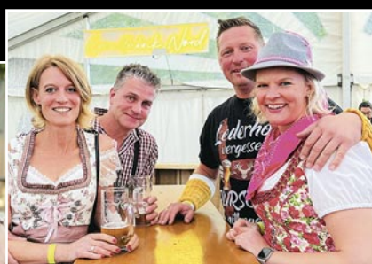
Das Festzelt des Oktoberfestes der Schützengilde Herzebrock war gefüllt mit Feierfreudigen in bayerischen Trachten.