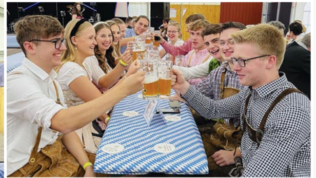
Das Oktoberfest lockte auch dieses Jahr wieder Jung und Alt zum Feiern ins Festzelt in Herzebrock.