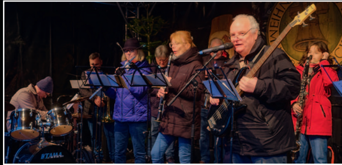
Der Musikverein Herzbrock-Rheda sorgte auf dem Herzbrocker Weihnachtsmarkt für Stimmung