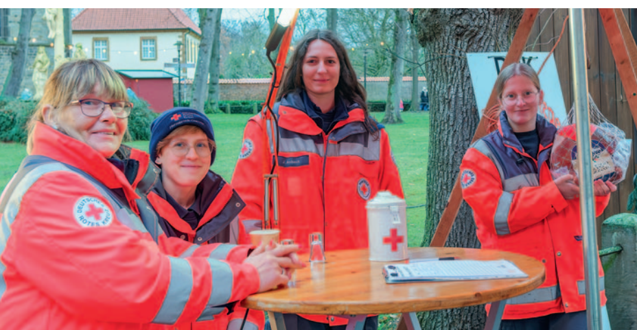
oben: Heiße Glühkirsche gab es am Stand des Schützenthrons 2023/24.