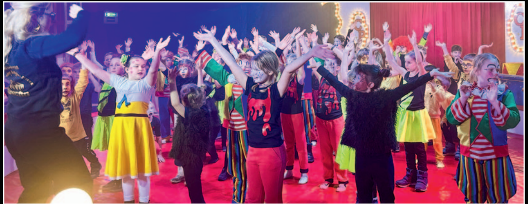
Die jungen Artistinnen und Artisten beim gemeinsamen Tanz in der Manege des Projektcircus' Proscho