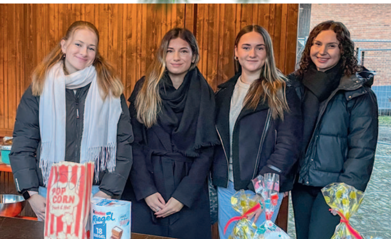
Die Abschlussklasse der Gesamtschule Herzebrock besserte ihre Abi-Kasse mit dem Verkauf von Popcorn, Crêpes, Mandeln und Gebäck auf.